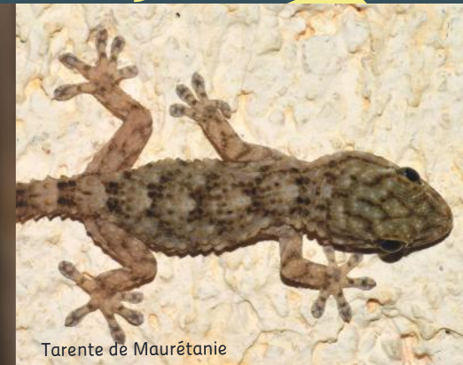
Tarente de Maurétanie