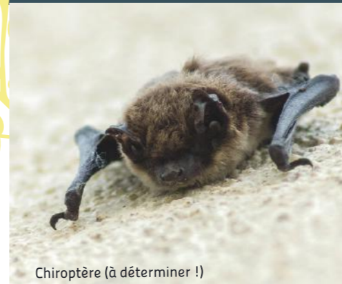
Chiroptère (à déterminer !)

La nuit, la vie s'éveille dans votre jardin. Dès que la porte est close, que les lumières sont éteintes et que le calme règne dans ce petit bout de nature, la vie se révèle et prend possession des lieux.