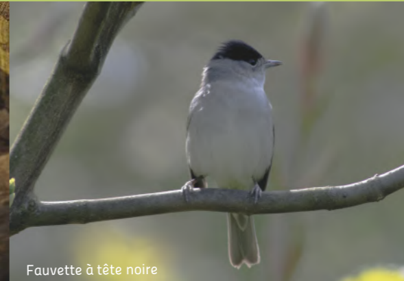
Fauvette à tête noire